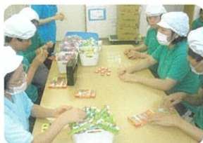
トップガムの箱詰め作業