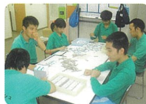
ケシゴムの箱詰め作業