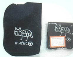
オリジナルエコバッグ