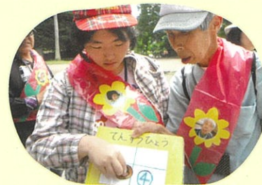
オリエンテーリング