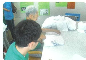
保育所の布おむつたたみ作業