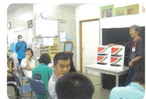
月1回の「にこにこクラブ」 (絵本や創作活動)