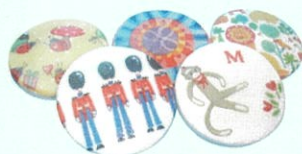
デコパージュセっけん