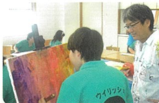
週1回おこなわれる絵画教室

毎日厨房にて調理員2名が、美味しい昼食を用意してくれています！！ 2種類の定食から食べたい方を選ぶことができます★