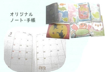
オリジナル ノート・手帳