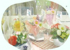
フラワーアレンジメント